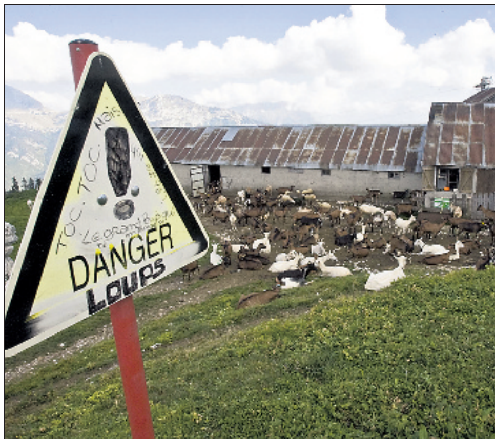
Sur l'alpage du Margeriaz, dans les Bauges, plusieurs attaques ont déjà eu lieu, la dernière victime étant une vache tarine. Une autorisation de tir a été demandée, mais les chasseurs et les éleveurs sont très sceptiques sur l'efficacité de la méthode expérimentée dernièrement à Montsapey.

En 1997, le loup pointait son nez en Savoie, au-dessus de Bramans. Première étape d'une colonisation qui a révélé un territoire très favorable, tant par le relief que par le garde-manger, sauvage et domestique. Mais dix ans plus tard, les solutions mises en place ne satisfont personne. Et alimentent une guerre des nerfs incessante entre éleveurs, chasseurs, écologistes et administration. Une administration muselée par une autorité qui refuse de jouer la transparence, réduite à mettre en place des mesures de tirs auxquels elle ne croit pas elle-même. La dernière expérience menée à Montsapey a été qualifiée de "mascarade", tant par les éleveurs que par les chasseurs mobilisés sur le ter-